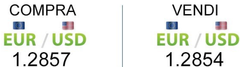
Fig 2.1 - La coppia EUR/USD può essere acquistata a 1.2857 o venduta a 1.2854