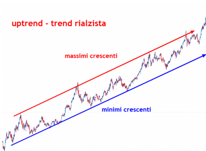
Fig 3.1 - Un esempio di uptrend o trend rialzista

Per comprendere meglio i picchi ai quali facciamo riferimento diamo uno sguardo al seguente grafico: