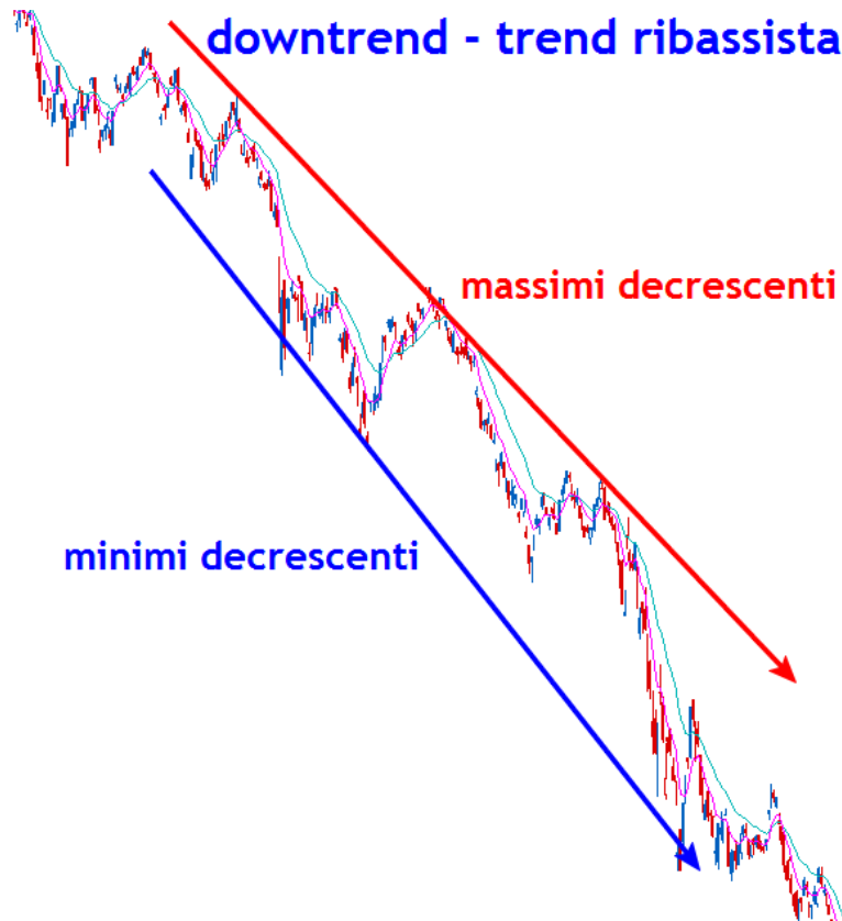
Fig 3.2 - Un esempio di trend ribassista o downtrend

Il grafico in figura 3.1, ci mostra un trend al rialzo: il trader dovrebbe dunque comprare la coppia di valute e chiudere la posizione vendendola con profitto.